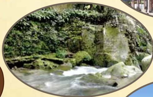
せきよし ぞ すいこう 関吉の辣水溝