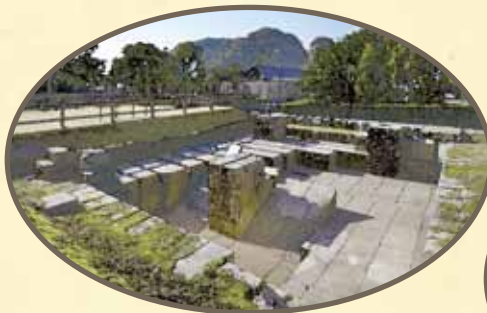
きゅうしゅうせいがん はんしゃ ろ あと 旧集成館(反射炉跡)

平成27年7月に 「明治日本の産業革命遺産」が 世界文化遺産に登録されました。 鹿児島県世界文化遺産課では、 登録1周年を記念し、 県内の小学生に広く 「明治日本の産業革命遺産」の 価値や意味について 理解していただくことを目的として、 作文コンクールを実施します。 なお、入賞作品については、 県ホームページ等に掲載し、 広く県民に公表する予定です。