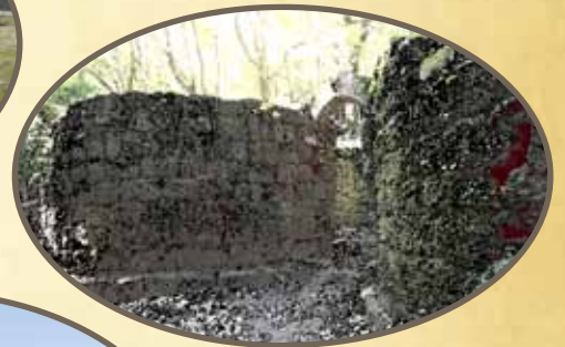
てらやますみがまあと 寺山炭窯跡