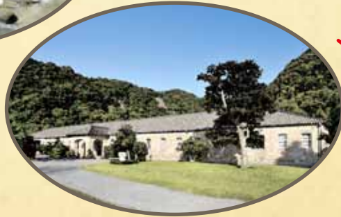
きゅうしゅうせいがん き かいこうじょう しょうこしゅうせいがん 旧集成館機械工場(尚古集成館)