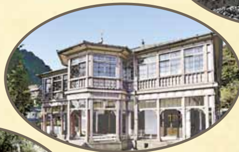
きゅうか ごしまほうせきじよぎ しかん 旧鹿児島紡績所技師館 (異人館)